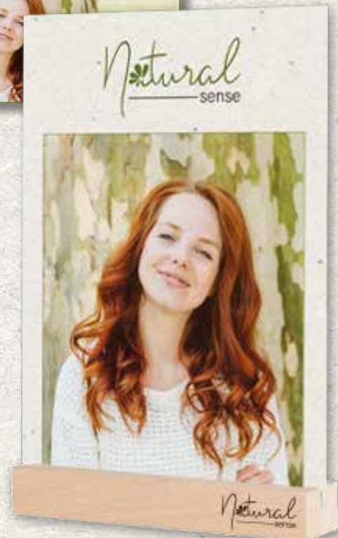
Aufsteller DIN A4