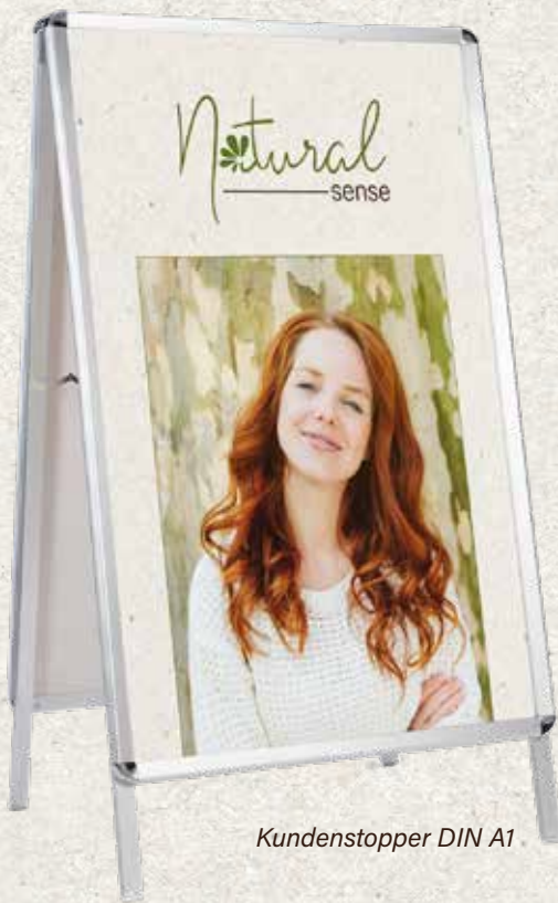
Kundenstopper DIN A1