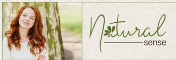
Homepage Banner 1920 x 640px