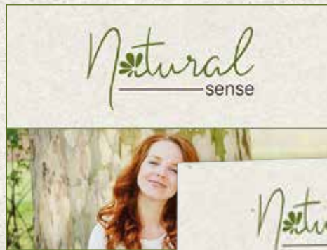
Homepage Banner 840 x 630px